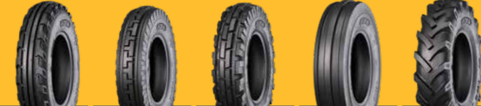
KNK30 KNK32 KNK33 KNK35 KNK50