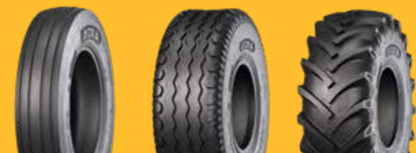
KNK36 KNK48 KNK50