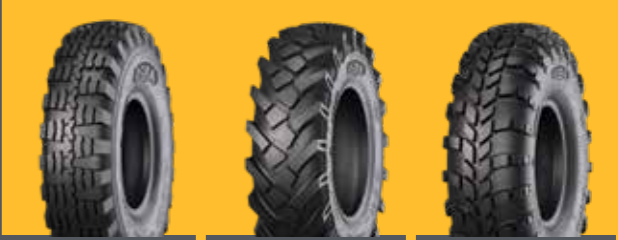
KNK10 KNK12 KNK14