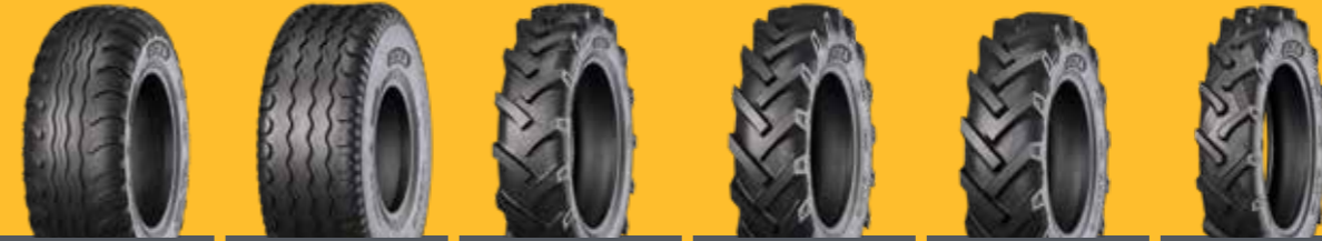
KNK42 KNK48 KNK50 KNK52 KNK54 KNK140