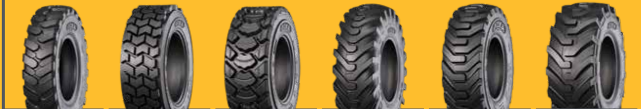
KNK44 KNK65 KNK66 IND80 IND85 IND88