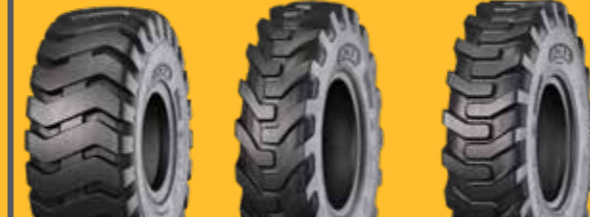
KNK70 KNK72 KNK74