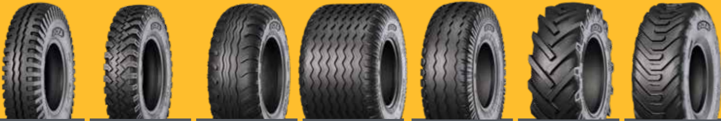
KNK27 KNK28 KNK42 KNK46 KNK48 KNK52 KNK56