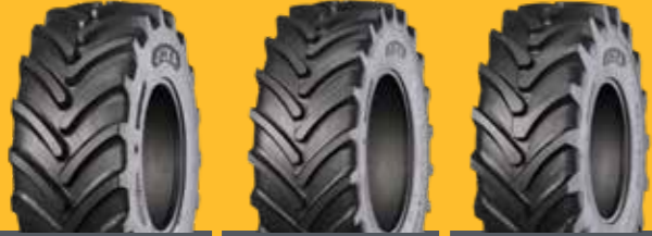
AGROLOX AGRO10 AGRO11